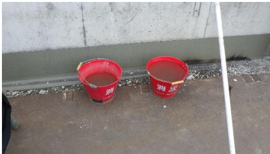
(写真3-3) 消火バケツ設置状況