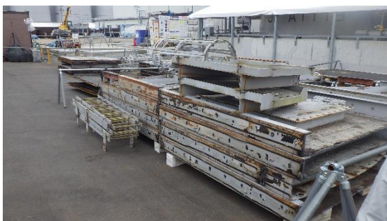
(写真 2 - 2) 解体片保管状況