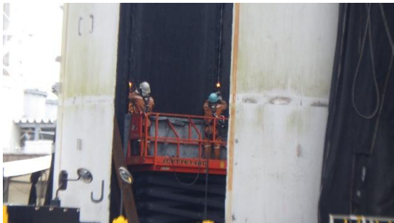
(写真 1 - 4) 側板の解体状況②