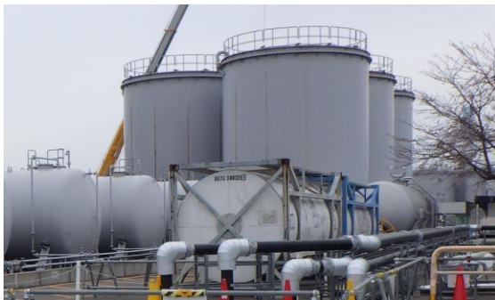
(写真1-1) J8タンクエリアの状況 (西側から撮影)