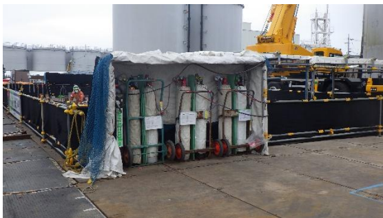
(写真3-4) ガスポンペ設置状況