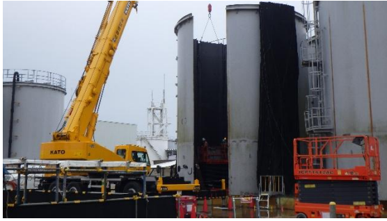
(写真 1 - 3) 側板の解体状況①