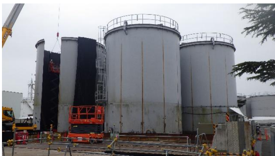
(写真1-2) J8タンクエリアの状況 (北西側から撮影)