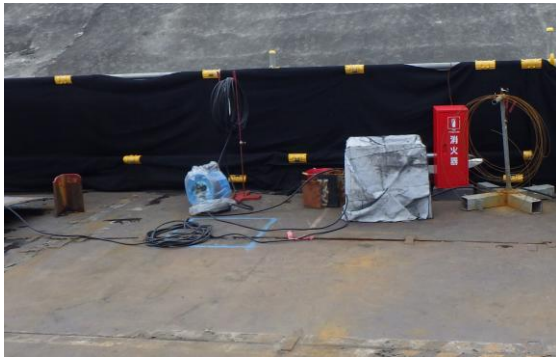
(写真3-2) 消火器設置状況