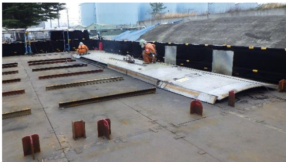
(写真 2 - 1) 解体片細断の状況