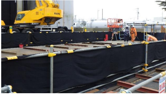
(写真3-1) 養生シート設置状況