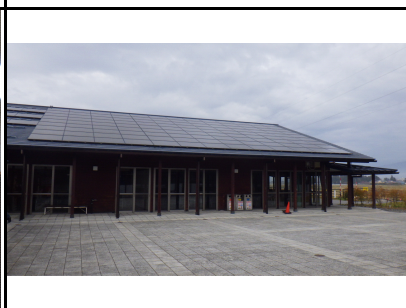
既存太陽光パネル