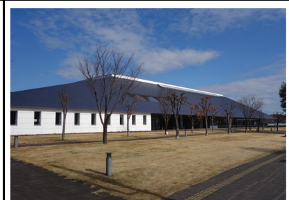
外観(南面 G・Hエリア)