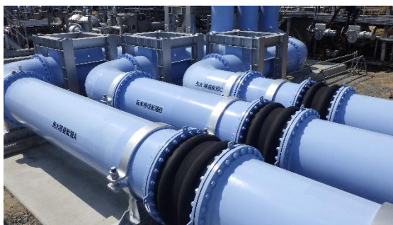
(写真3①) 海水移送配管の敷設状況