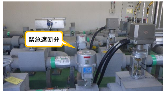
(写真2) 緊急遮断弁の設置状況