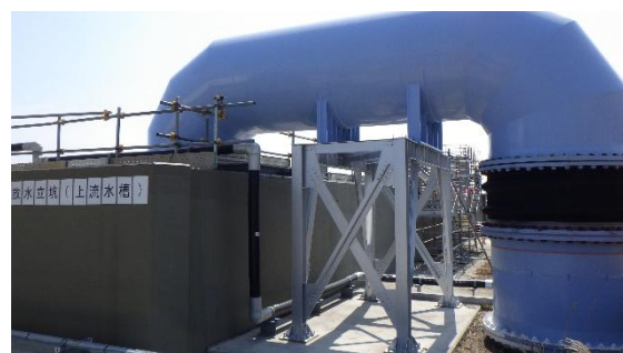
(写真3②) 放水立坑の状況