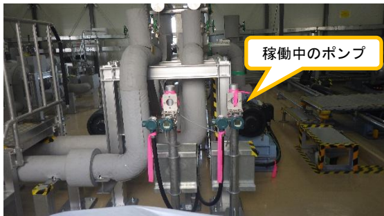
(写真1) 移送ポンプの設置状況