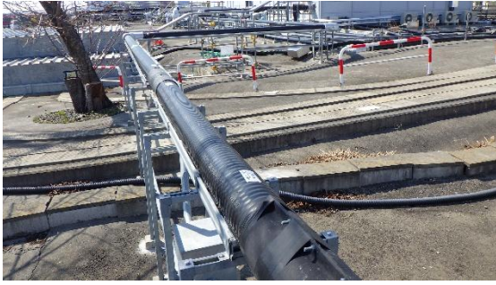
(写真 4 ①) 移送配管の敷設状況①