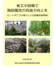
▲省エネで収益力向上を

省エネ機器の導入に加え、被覆の多層化や循環扇の導入、環境制御装置の導入など様々な手段を用いて燃料使用量50%以上削減に取り組みましょう！