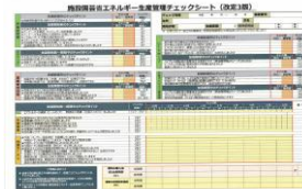
▲省エネチェックシート