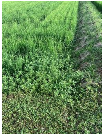
▲水稲に絡みつきながら生育するナガエツルノゲイトウ

また河川や池で大群落となり水面をマット状に覆うことで、水路を塞ぎ、取水・排水の障害になることがあります。