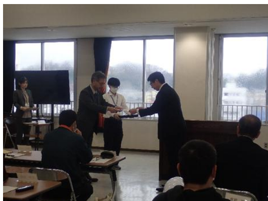
▲辞令交付式の様子