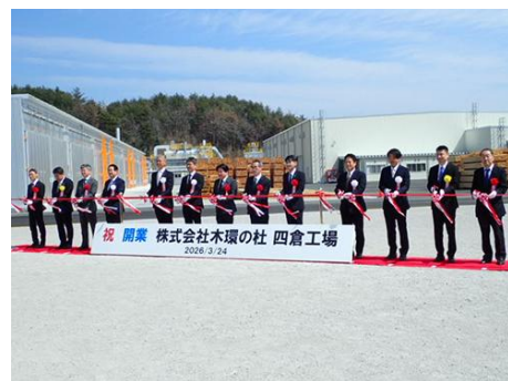
▲テープカットの様子