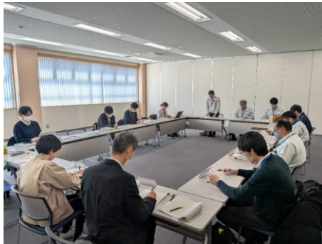
▲ワーキンググループの様子