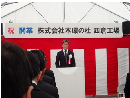
▲安永代表取締役挨拶