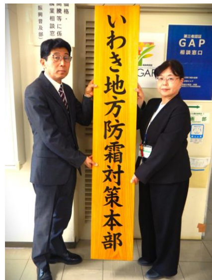
▲いわき地方防霜対策本部 看板設置 (左：上野前所長、右：荻野部長)