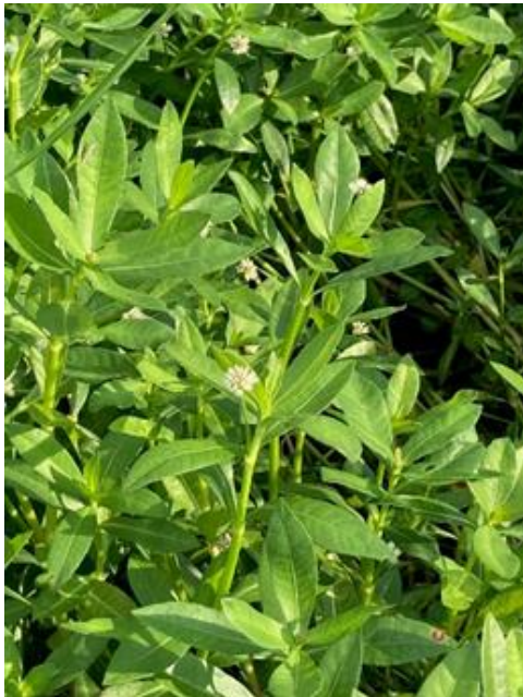
▲開花しているナガエツルノゲイトウ

本種は河川、水路、ため池、水田、あぜなどのほか、乾燥に強いため畑でも生育します。開花時期は4月～10月で、種子をつけず茎や根で増殖します。茎は再生力が強く、数センチの断片からでも発根します。また茎は千切れやすく水に浮くため、断片が用水・河川を介して運ばれることで新たな地に定着し再生する特徴があります。根は土中で50cm以上伸び、刈り取っても根断面から再生します。