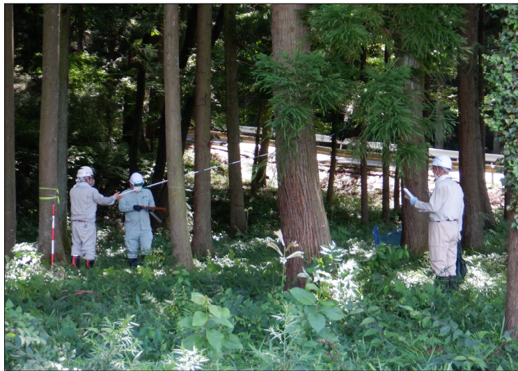
▲森林調査実習の様子(令和4年度)

※詳細は別添タイムスケジュール参照。なお、内容は予定であり変更となる場合があります。