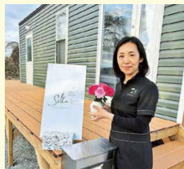
トレーラーハウス型美容サロン Silta 日高様 浪江町

■補助対象経費は、事業期間中に生じたものを対象としますので支払い等については、原則として、事業期間内に行ってください。