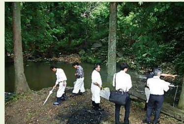
【平成25年度現地調査状況】