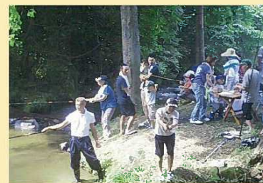
【釣り堀をする様子】