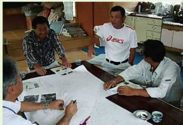
【平成25年度開催状況】