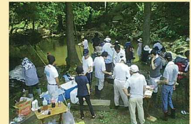
【右支夏井川淵前でのバーベキューの様子】