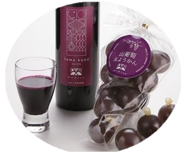
山葡萄 ジュースと玉ようかん