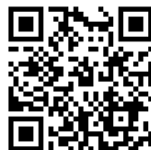
満天堂グランプリ Instagram