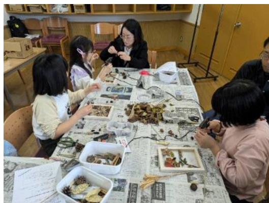
自然素材アート体験