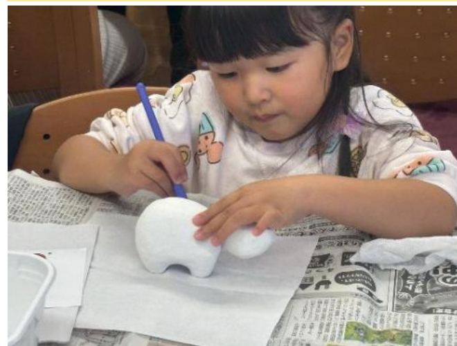
赤べこ絵付け体験