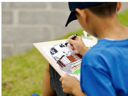
クレヨン絵画体験