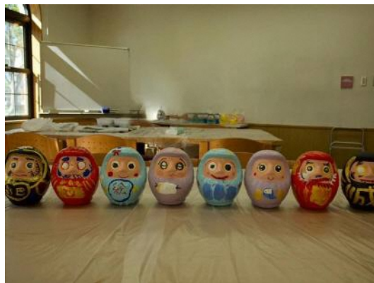
白河だるま絵付け体験