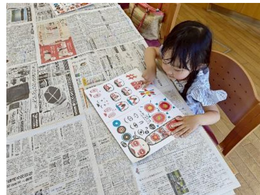
中ノ沢こけし絵付け体験