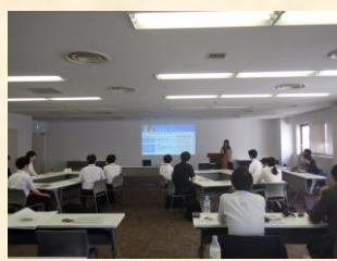
企業概要説明の実施