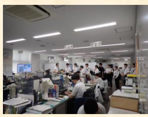
県庁のフロアを見学