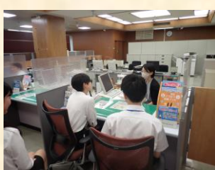
先輩行員にインタビュー