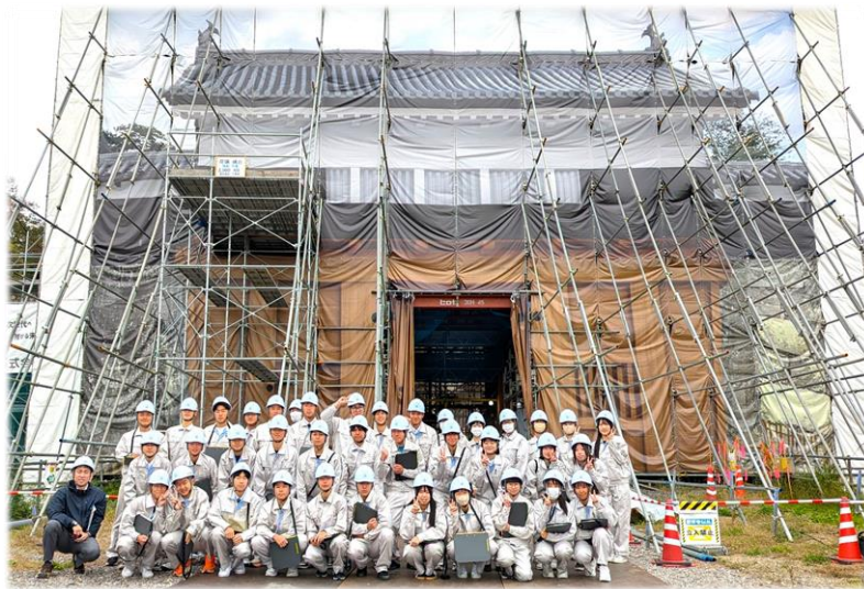
小峰城跡清水門 復元整備工事現場