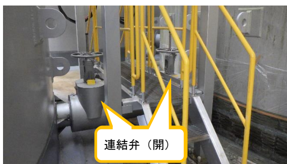
(写真1-1) 連結弁の状況