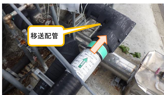
（写真３－２）ＡＬＰＳ処理水移送配管の状況②