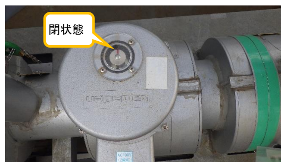
(写真1-2) 出口弁の状況