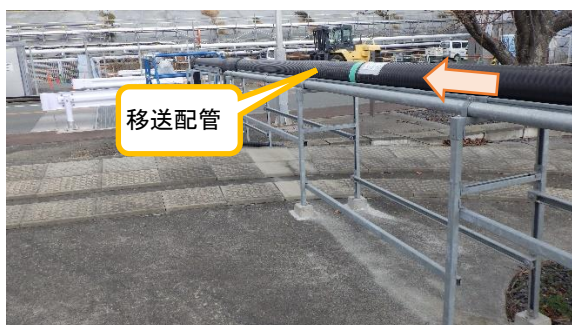
（写真３－１）ＡＬＰＳ処理水移送配管の状況①