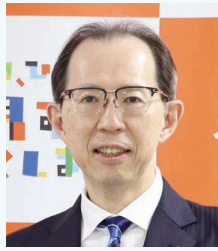
福島県知事 うちほり まさお 内堀 雅雄