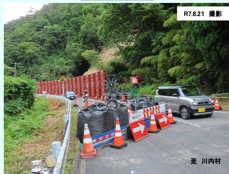
片側交互通行状況