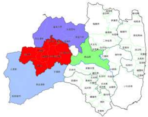
会津若松管内発注隣接3管内