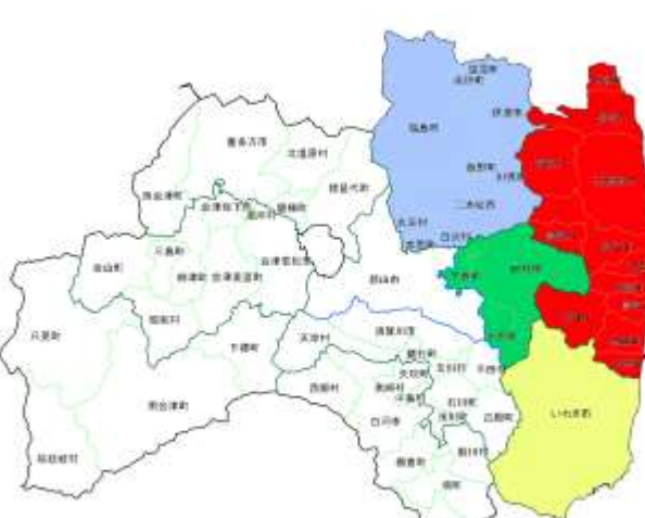
相双管内発注隣接3管内