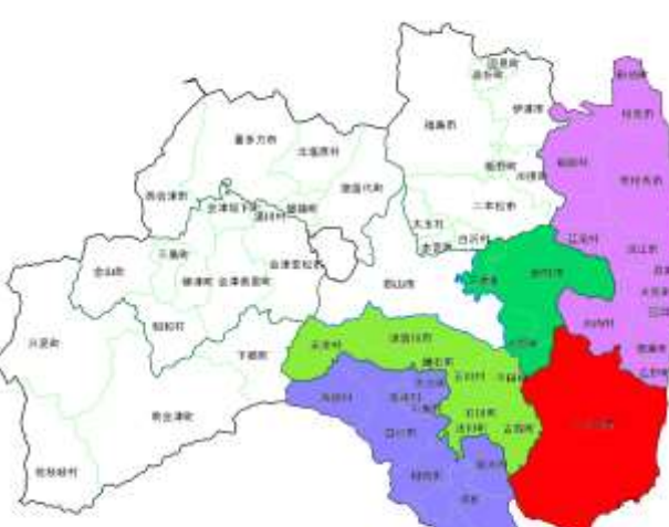
いわき管内発注隣接3管内