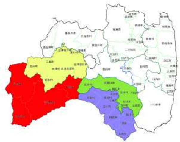
南会津管内発注隣接3管内