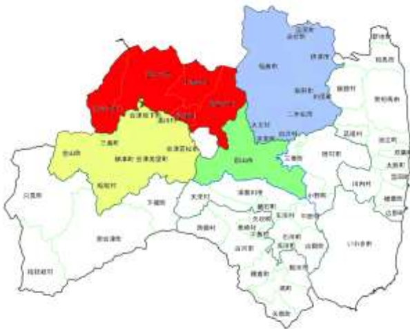
喜多方管内発注隣接3管内