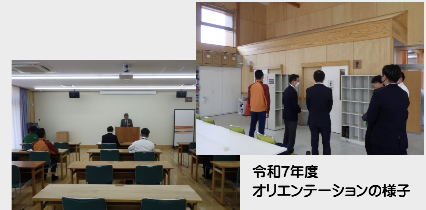
令和7年度 オリエンテーションの様子