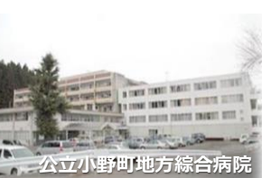
公立小野町地方総合病院