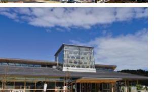
いいたて村までい館