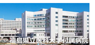
福島県立医科大学付属病院