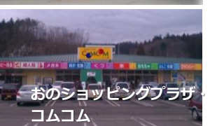
おのショッピングプラザ コムコム