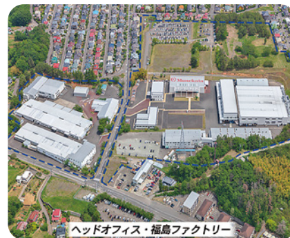
ヘッドオフィス・福島ファクトリー

ムネカタグループの広大な敷地の中には、11棟の建屋と2つの巨大倉庫があり、ワンストップのモノ創りや研究開発が行われています。社員駐車場も完備され、働く環境はバッチリです。