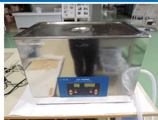
超音波洗浄装置 (200円/時間)