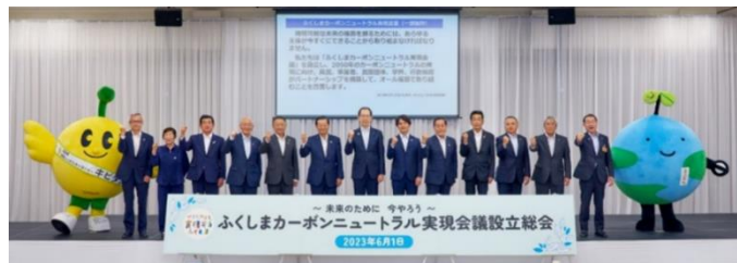
ふくしまカーボンニュートラル実現会議