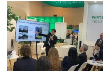
福島県・NRW州再エネセミナー（E-world energy & water会期）