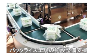
バックライス工場の施設整備支援