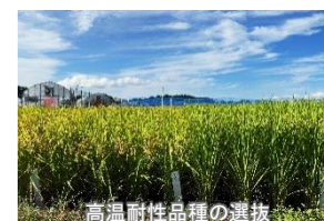
高温耐性品種の選抜