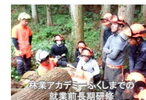
林業アカデミーふくしまでの就業前長期研修