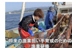
将来の漁業担い手育成のための漁業研修