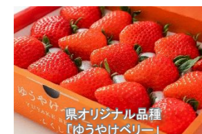
県オリジナル品種「ゆうやけベリー」