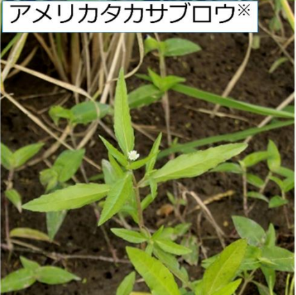
アメリカカタカサブロウ※