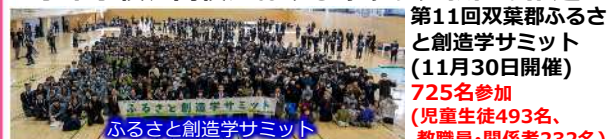
ふるさと創造学サミット

第11回双葉郡ふるさと創造学サミット (11月30日開催) 725名参加 (児童生徒493名、教職員・関係者232名)