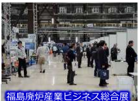
福島廃炉産業ビジネス総合展