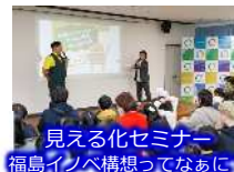
見える化セミナー 福島イノベ構想ってなあに?