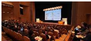
Fukushima Tech Create2025 成果報告会