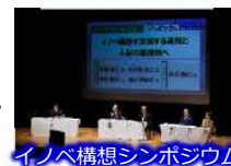
イノベ構想シンポジウム

12月7日 稲葉町コミュニティセンター 来場者数：195名(オンライン視聴：64名)