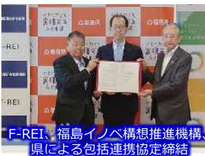
F-REI、福島イノベ構想推進機構、県による包括連携協定締結