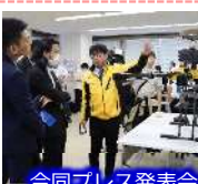
合同プレス発表会