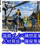
福島イノベ構想産業人材育成・確保事業

工業高校生等を対象とした地元企業の見学等の取組を支援し、地元就職を促進する事業。