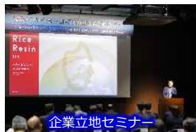
企業立地セミナー

企業立地件数：433件 雇用創出数：4,972人(R6年3月末時点) ※新増設に対する補助金の採択ベース