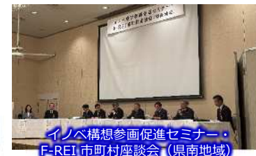
イノベ構想参画促進セミナー・F-REI市町村座談会(県南地域)