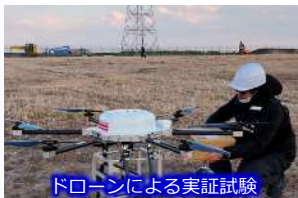
ドローンによる実証試験