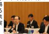
イノベ構想推進分科会