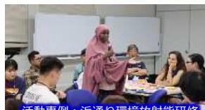
活動事例：浜通り環境放射能研修(大阪大学)