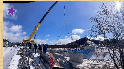
【橋梁上部工架設状況(令和7年2月)】