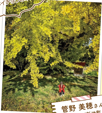
菅野 美穂さん 撮影地/新地町 (白幡のいちよう)