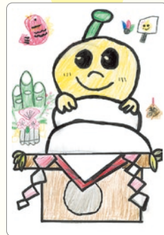
かがもち いちばうえ 鏡餅の一番上 キビタンになっているね!