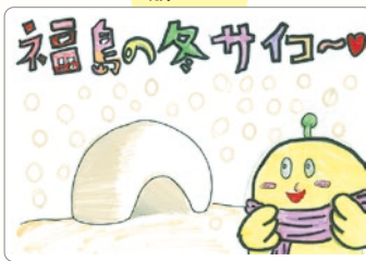
マフラーを巻いているキビタンもかわいいね!