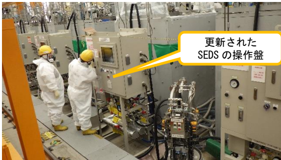
(写真3) S E D S 試運転に向けた系統構成の 確認状況