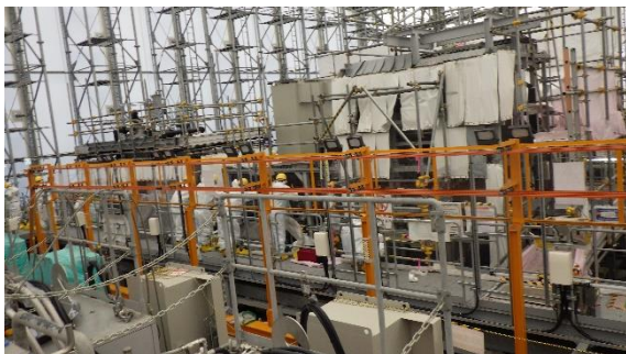
(写真1-1) CFF：A系の新規ホース・ケーブル接続に伴う系統構成の状況①