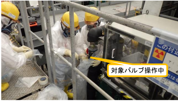
(写真2) C F F : A系の新規ホース・ケーブル 接続に伴うバルブ点検の状況