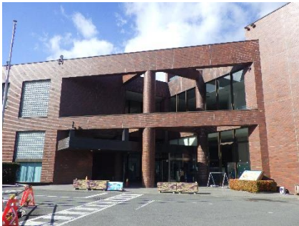
女川原子力PRセンターの様子①