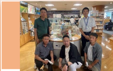
● 農業青年クラブの取組