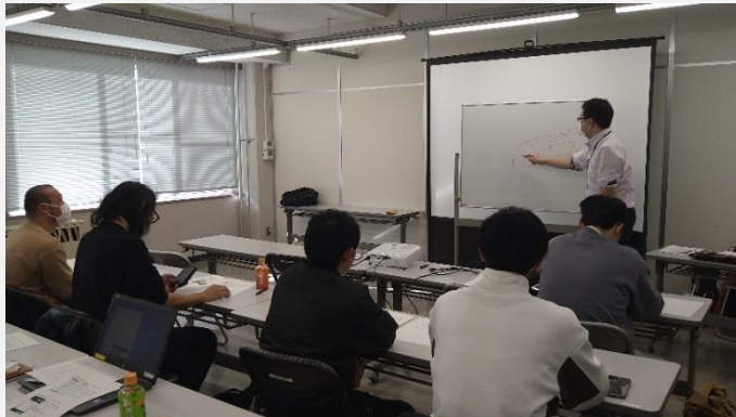
「通い農業支援システム」検討会

比較的低コストで導入でき、ユーザーがカスタマイズできるハウス遠隔監視システム「通い農業支援システム」を用いた栽培管理（野菜：ハウスの温度管理、果樹：凍霜害対策等）を向上させるため、勉強会や検討会を開催しました。また、システムに興味がある生産者を招いた座談会を開きました。