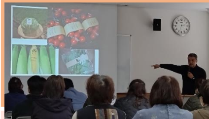
● 直売所づくり研修会