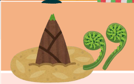
● 山菜の季節が到来！