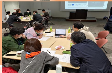
● 新規就農者交流会