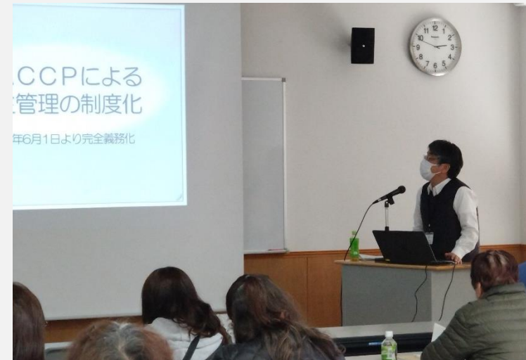
県南保健福祉事務所鈴木主査からの情報提供