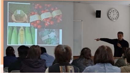
● 直売所づくり研修会