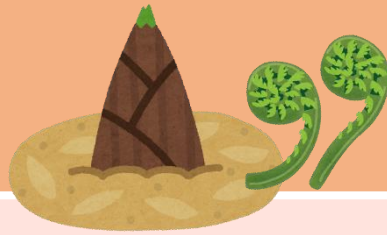
● 山菜の季節が到来！