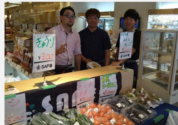
日本橋ふくしま館MIDETTE直売会

日本橋ふくしま館MIDETTEでの直売会を行いました。キュウリ、トマト、なし、ぶどうの販売を行いました。なし、ぶどう、トマトは試食も行い、おいしさをアピールしました。暑い季節に開催したので、みずみずしいなしがととても好評でした。