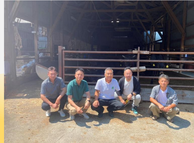
和牛のブランド化に取り組む農業法人を視察しました。（視察研修会）

令和6年度は、地元棚倉町のイベントでの農産物販売や大阪で視察研修を行いました。研修ではブランド化の先進事例を学び、大いに刺激になりました。