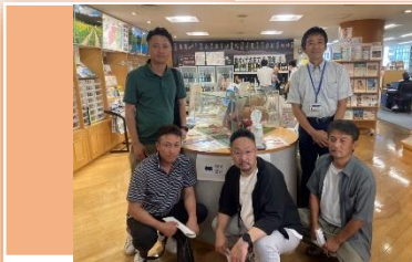
● 農業青年クラブの取組