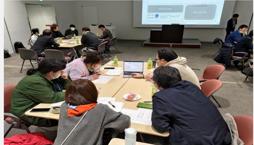
2部 交流会（ワークショップ）「生成AIの活用方法」

県南地域の新規就農者等を対象とし、営農の初期段階に必要な知識及び将来の経営発展に役立つ情報の提供と参加者の交流を図ることを目的として、令和7年2月4日（火）に白河市立図書館で開催しました。