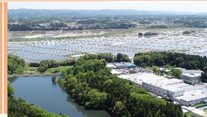
● 農業農村整備事業