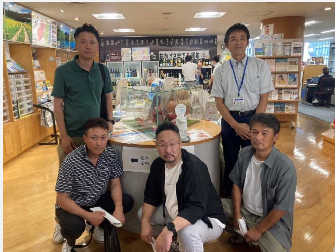
福島県大阪事務所のサテライトショップを視察しました。（視察研修会）

クラブでは新規会員募集中ですので、活動に興味のある方は農業振興普及部へお問い合わせください！