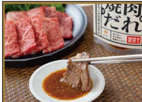
焼肉だれ【旨甘あじ】

「ニンニク × ショウガ × 桃」が織り成す絶妙なバランスが特長の焼肉のタレ。福島県産の桃を加え、程よい甘みと旨味を引き出しました。辛くなく甘すぎない味わいは、肉もごはんもとまらない美味しさ。「カラダよるこぶ元気みなざる」家族みんなでお召し上がりいただけるタレに仕上げました。焼肉のつけだれはもちろん、肉への漬け込みやチャブチェにもよく合います。