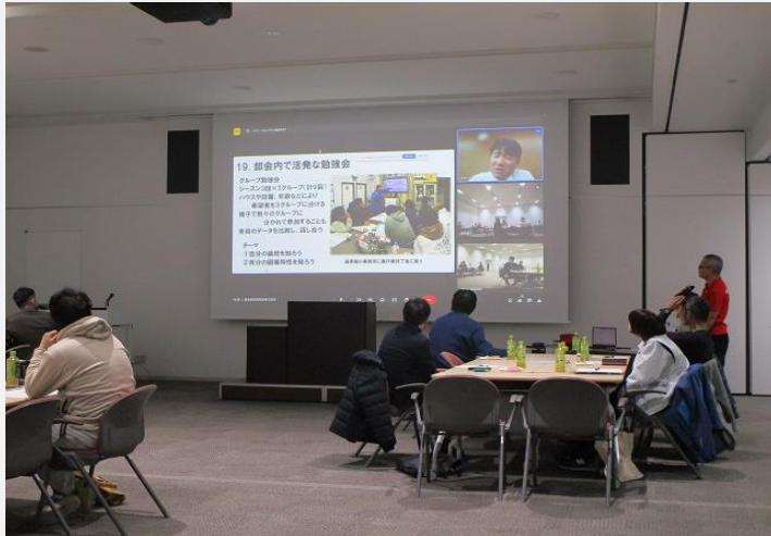
1部 講演「農業におけるDXとは」