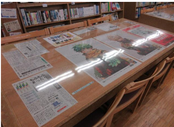
（（写真④：図書に関する情報 新聞記事）