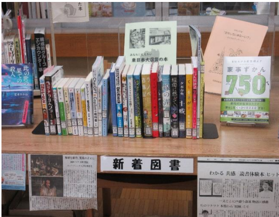
(写真①：図書新着コーナー)