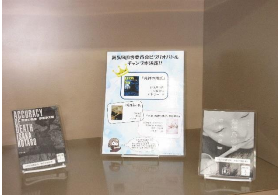
(写真⑤)：ピブリオバトルでの紹介本の掲示