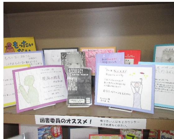
(写真②：図書委員作成のPOP)