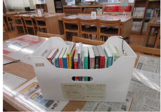
(写真⑥)：「図書の本文庫」の設置