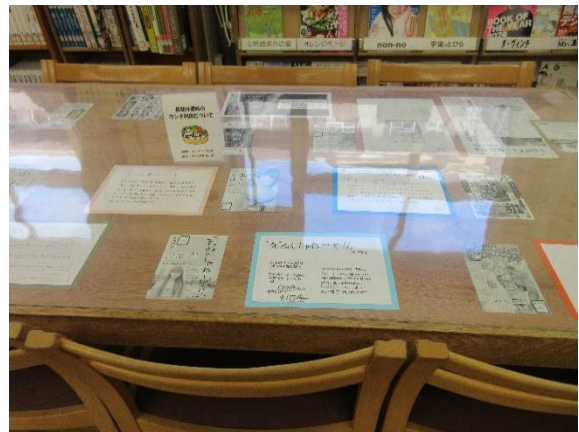
（写真④：図書に関する情報 POP）