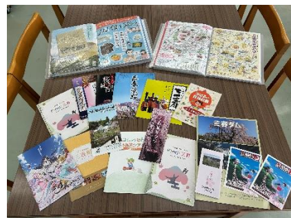
各市町村のパンフレット