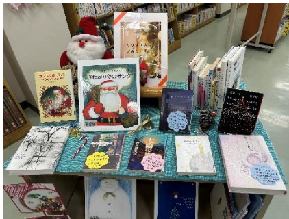
12月展示「クリスマスに読みたい本」

常設の展示には「新着図書」「進路を考える」「看護・医療・福祉をめざすあなたへ」「小論文入試で出題の多い本」「探究学習におすすめの本」があり、テーマごとに関連する本を展示している。また、図書館内 2 か所のスペースを使い時事展示を行っている。時事展示では季節・行事・時事問題などにあわせて、月替わりでテーマを設定している。