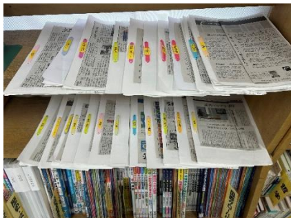
テーマ別新聞スクラップ

新聞記事を「医療」「保育」「教育」「スポーツ」など 20 以上のテーマごとにスクラップし、探究学習や進路活動に利用している。また、各市町村が発行しているパンフレットをファイルにまとめており、地域探究の際に役立てている。