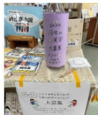
11月イベント 「田高生の今年の漢字大募集」