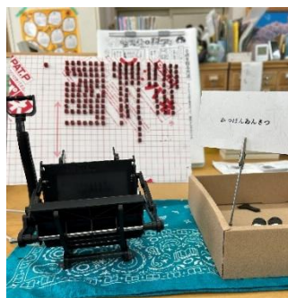
10月イベント 「活版印刷をやってみよう!」

図書館に足を運んでもらえるよう、季節に合わせてイベントを企画し実施している。R6年度の10月には読書週間に合わせて「活版印刷をやってみよう!」「イラスト募集」、11月には「田高生の今年の漢字大募集」、12月には「まっぴょくりツリーを作ろう!」、1月には「雑誌配布大会」を行った。