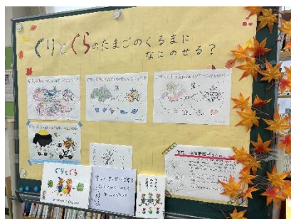
10月イベント 「イラスト募集」