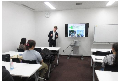
県国際交流員による本県の現況説明