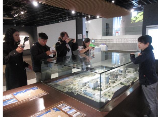
福島第一原子力発電所の模型を見ながら説明