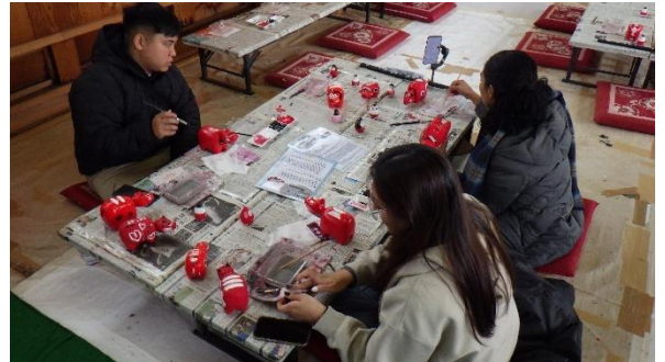
赤べこの絵付けに挑戦