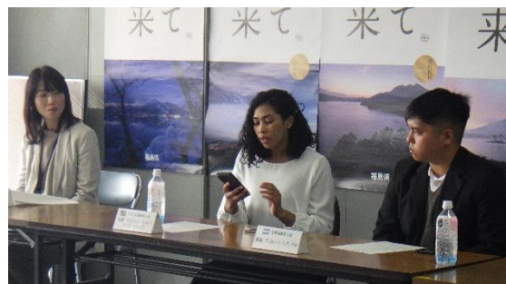
意見交換会の様子