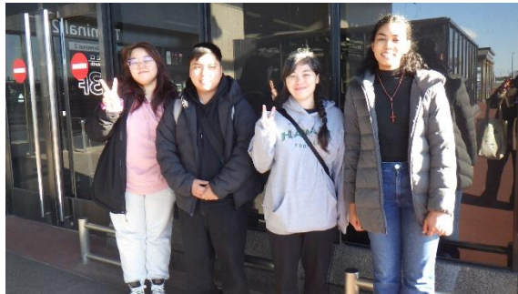
成田空港前で最後の記念写真