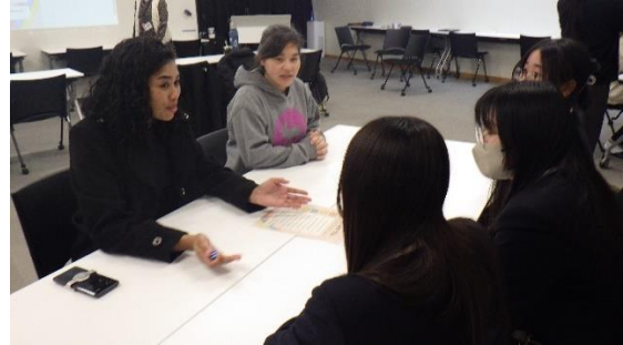
グループに分かれて交流