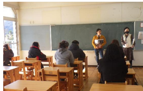
同施設の取組について説明を受ける