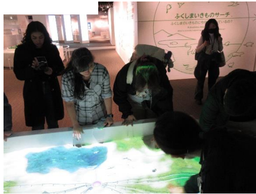
展示を楽しんでいる様子