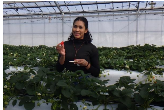
いちご狩りの様子