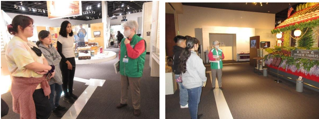
JICA 海外移住資料館視察の様子