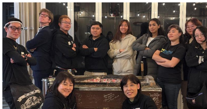
松川浦旅館の若旦那たちと記念撮影