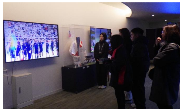
同施設の取組について説明を受ける