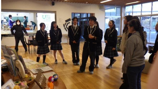
校内を案内してもらう