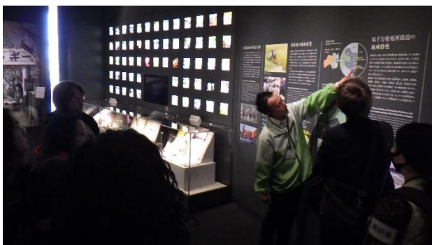
スタッフから展示物の説明を受ける