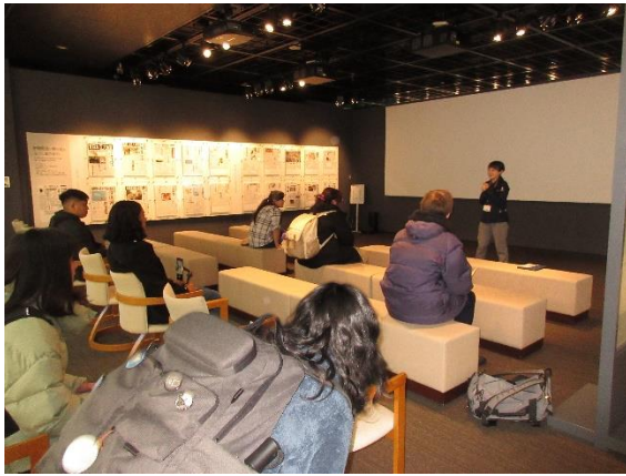
動画による説明を受ける