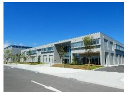
福島ロボットテストフィールド