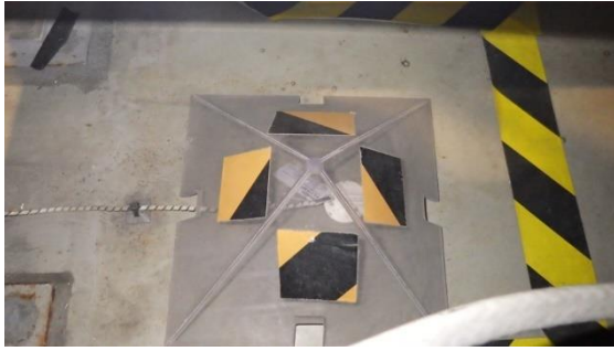
(写真 2 - 3) 漏えい検知器の設置状況②