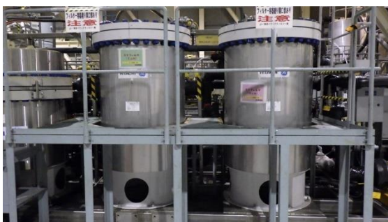
(写真1-2) 前処理フィルタの設置状況