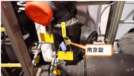
(写真 3) バルブの施錠状況