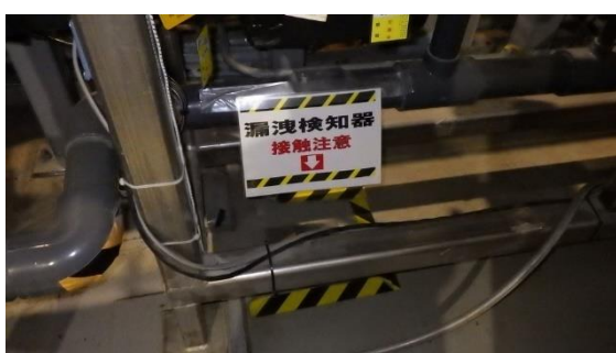
(写真2-2) 漏えい検知器の設置状況①