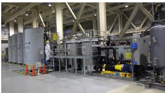
(写真1-1) サブドレン他浄化設備建屋内部の状況