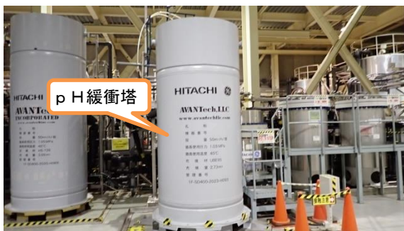
(写真1-3) pH緩衝塔の設置状況