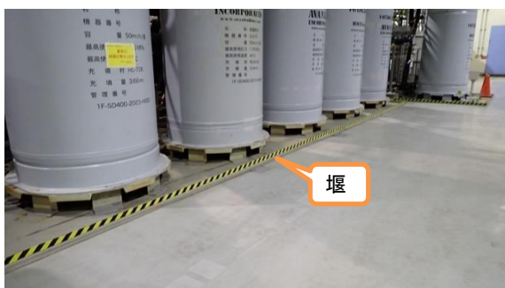
(写真2-1) 堰の設置状況