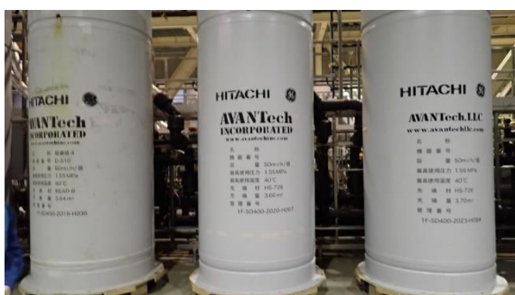
(写真1-4) 吸着塔の設置状況