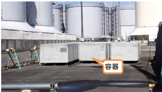
(写真 4) 前処理フィルタを収納するための容 器の仮置き状況