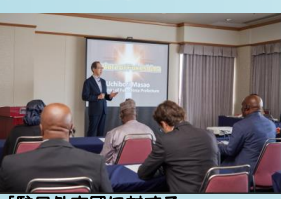
【駐日外交団に対する情報発信の様子】