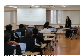
【魅力ある職場づくりに関する出前講座の様子】