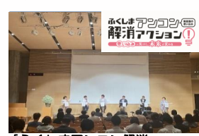
【ふくしまアンコン解消アクションイベントの様子】