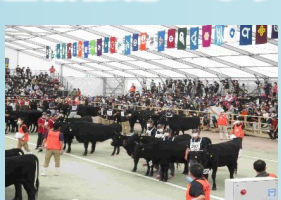
【全国和牛能力共進会の様子】