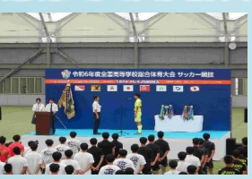
【Jヴィレッジ活用促進事業】