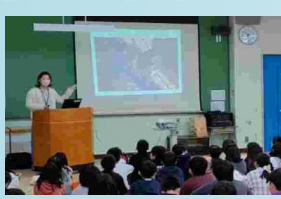
【そなえるふくしま防災事業】