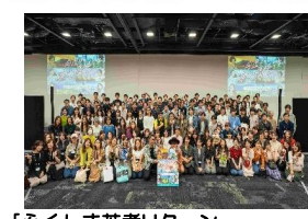
【ふくしま若者Uターン促進プロジェクト事業】