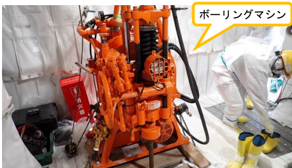
(写真1-2) ボーリングマシンの設置状況