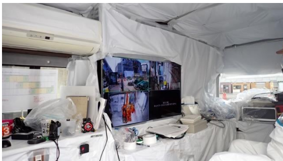
(写真 2 - 2) モニターカー内部の状況