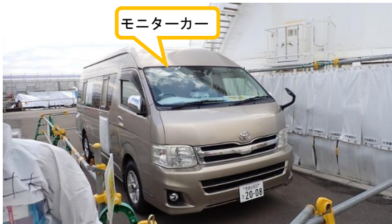
(写真 2 - 1) モニターカーの状況