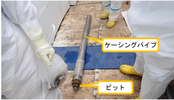
(写真 1 - 3) 削孔に使用したケーシングパイプ及 びビットの状況