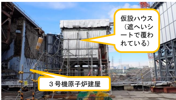
(写真1-1) 施工箇所周辺の状況