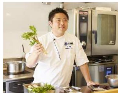
いわき市にあるフランス料理店のオーナーシェフ。レストラン内に加工場を構え、6次化の支援も行っている。

加工体験に参加される場合には、エプロン、マスク、三角巾スリッパ等をご持参ください。 ※トマトはこちらで準備いたします。