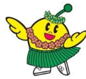
フラキビタン

書類の作成が不安な場合は、 お手伝いいたします！ 申請前のご相談・お問い合わせも 受け付けていますので まずはお気軽にご相談ください♪