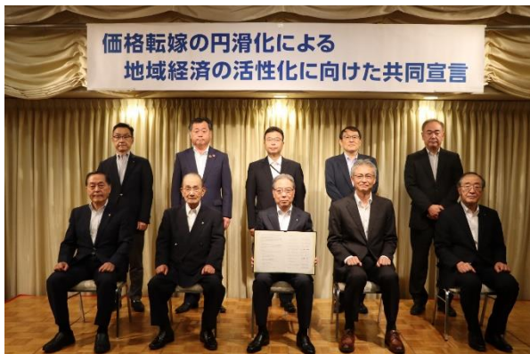
共同宣言式の様子（令和5年9月1日）

福島県では、経済団体・労働団体・行政機関の10団体の連名により、 「価格転嫁の円滑化による地域経済の活性化に向けた共同宣言」 を発出し 「適切な価格転嫁」 の機運醸成に連携して取り組んでいます。