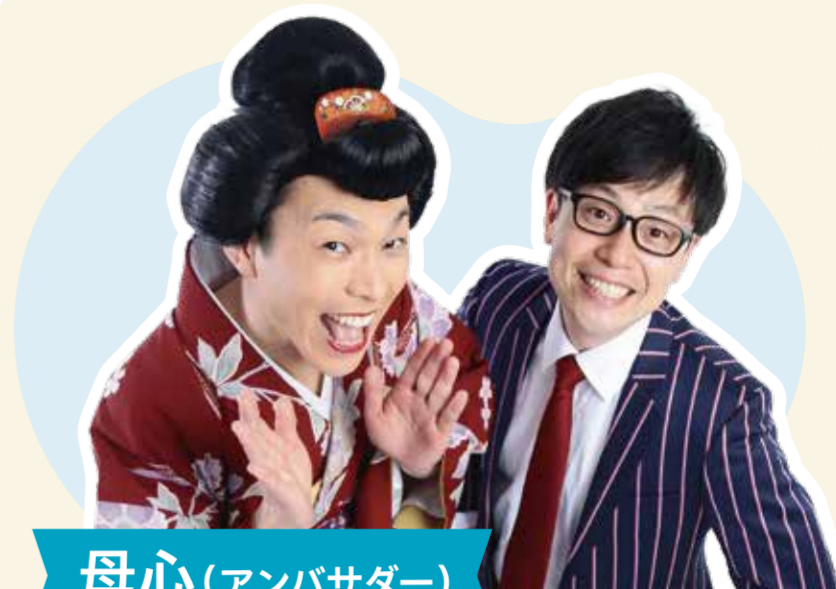
母心(アンバサダー)