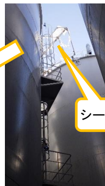
(写真3) A群天頂部にある雨除けシート及び治具類を撤去