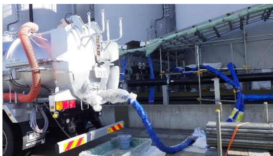
(写真1) B群タンク内残水を移送用の専用車を用いてC群タンクへ移送