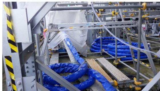
(写真2) 移送用ホース類及び移送用ポンプには、シート養生を実施