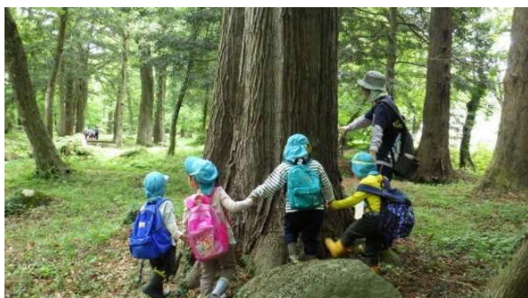
■子ども里山教育支援事業