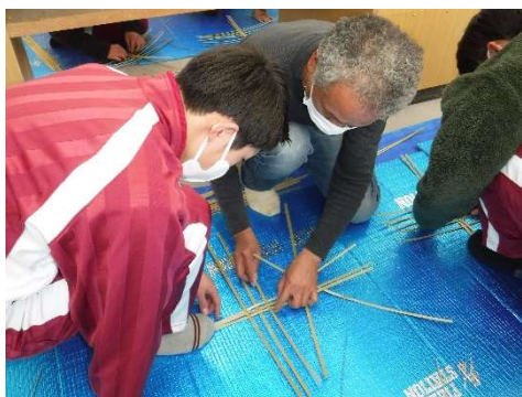
■森林文化出前講座