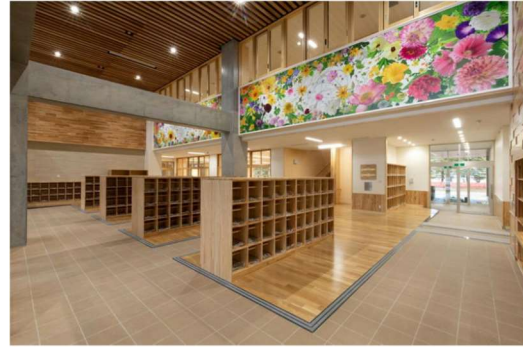
■ 県産材の利活用推進（地域提案重点枠）