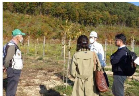
■ もり 森林の未来を考える懇談会