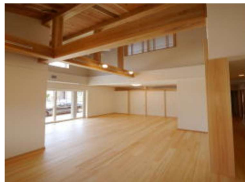
■ ポイント交付住宅