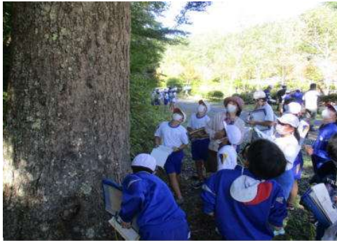
■ 森林環境学習を支援（森林環境基本枠）

た、図書館等の市町村有施設や小中学校、幼稚園等の施設において、県産材を使った木製品の導入 44 件、施設の内装木質化 44 件を実施しました。