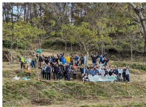
■会津桐玉植苗植樹祭