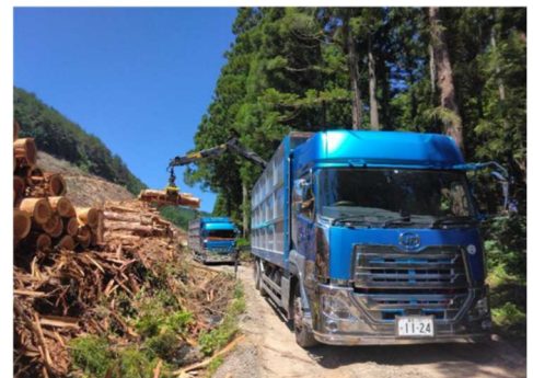
■ 間伐材搬出の支援