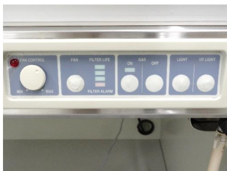
ファンコントロール設定