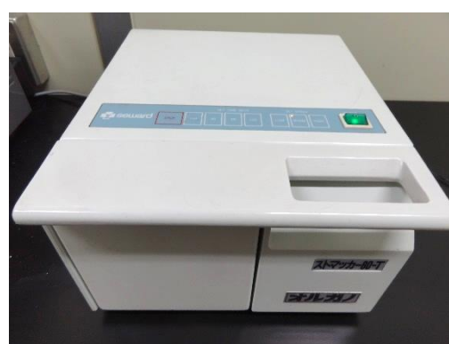
ストマッカー (200円/時間)