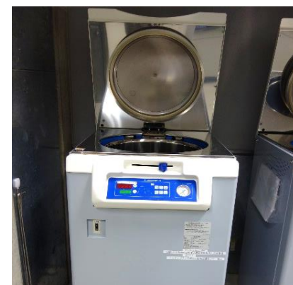
オートクレーブ (220円/時間)

○その他の施設・設備は、福島県ハイテックプラザ 施設・設備データベースからご覧いただけます。