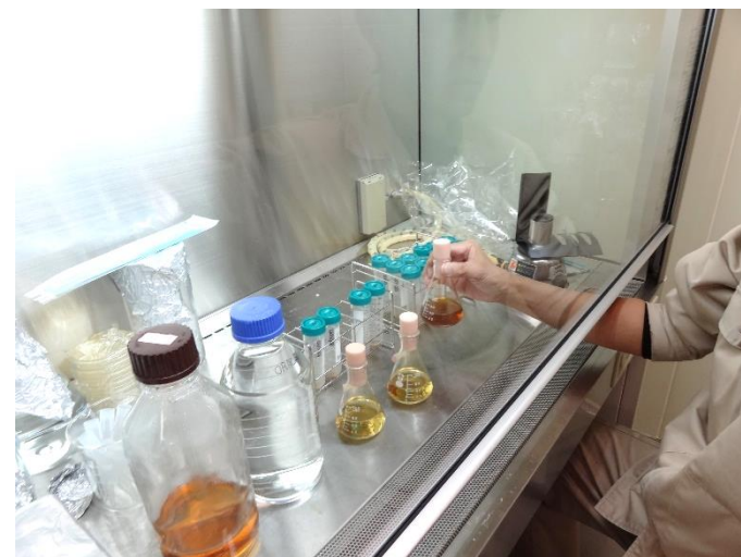
無菌状態での作業