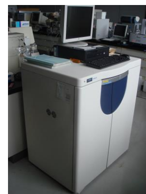
高速アミノ酸分析計 (3,080円/時間)

○その他の施設・設備は、福島県ハイテックプラザ 施設・設備データベースからご覧いただけます。