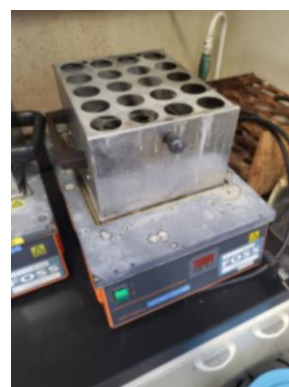
蛋白質蒸留/分解装置 (460円/時間)