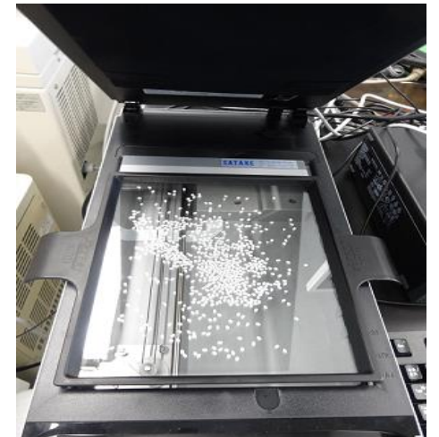
酒造原料米分析の様子