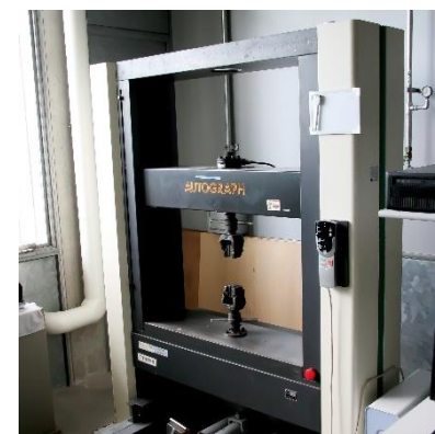
精密万能試験機 (2,240円/時間)

○その他の施設・設備は、福島県ハイテクプラザ 施設・設備データベースからご覧いただけます。