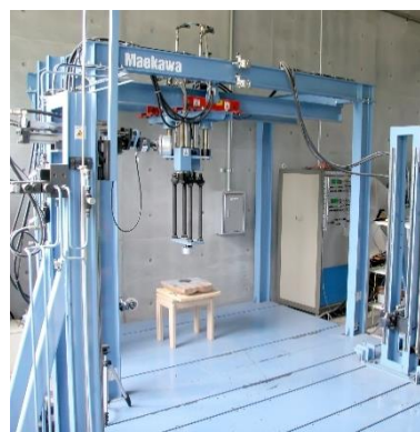
家具強度試験機 (5,330円/時間)