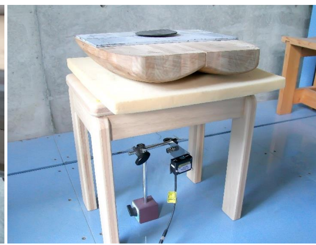
椅子の強度試験に活用（変位測定）