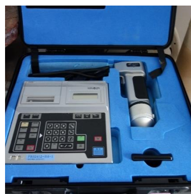
色彩色差計 (230円/時間)