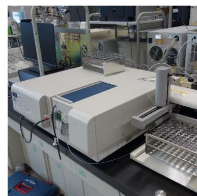
紫外可視分光光度計 (1,040円/時間)

○その他の施設・設備は、福島県ハイテクプラザ 施設・設備データベースからご覧いただけます。