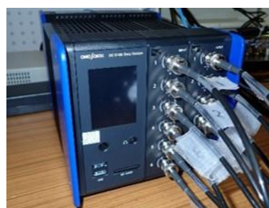
音響測定・解析システム (2,700円/時間)