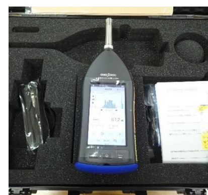
精密騒音計 (400円/時間)

○その他の施設・設備は、福島県ハイテクプラザ 施設・設備データベースからご覧いただけます。